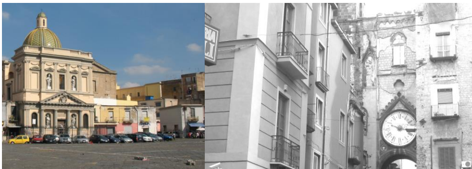
a) Chiesa di Santa Croce