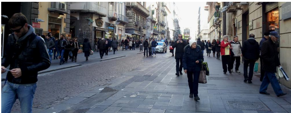
Fig. 1 – Via Roma, Napoli

tradizionalmente commerciali rischiano di perdere le loro qualità come generatori di spazi pubblici vitali nella città (Janssens e Sezer, 2013).