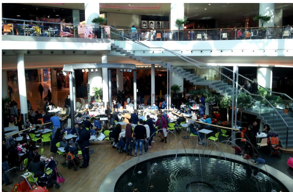
Fig. 3 – Centro Commerciale Campania Marcianise (CE)

Gli eventi della globalizzazione hanno dato vita a numerosi centri commerciali che sono solitamente progetti gestiti da un'unica società a cui le diverse imprese commerciali danno in gestione le strutture e le politiche commerciali e promozionali. Questi centri della grande distribuzione nascono allo scopo di concentrare in un unico spazio un considerevole numero di attività commerciali, così da offrire al consumatore un'ampia gamma di beni e servizi a cui accedere senza compiere lunghi spostamenti.