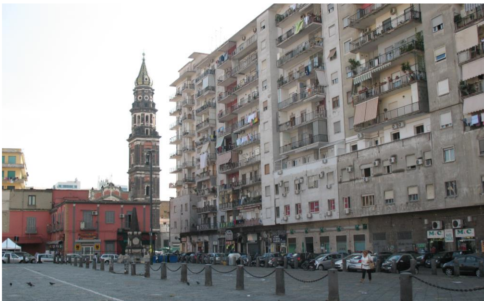
Fig. 5 – Il Palazzo Ottieri da Piazza Mercato