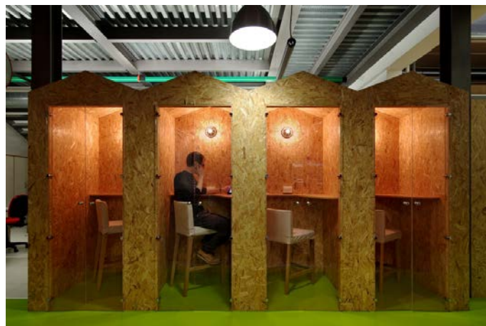
Fig. 5 – Login Milano. Le Phone Boots