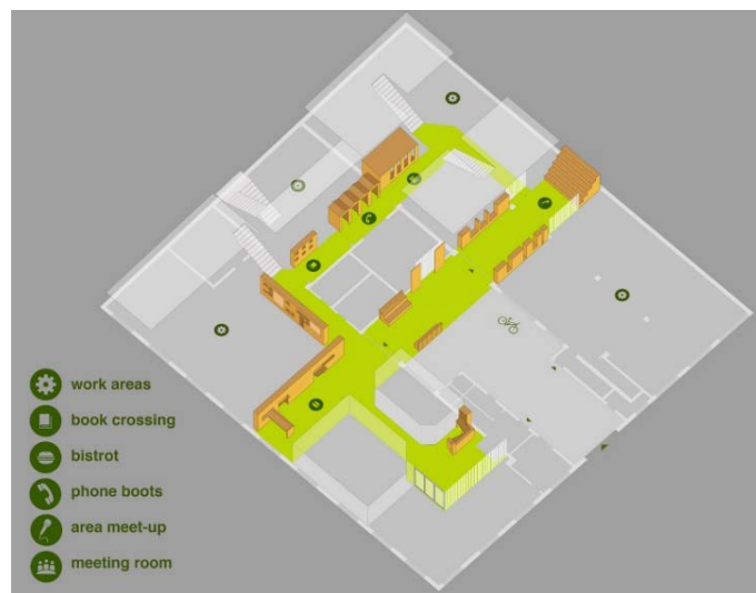
Fig. 2 – Login Milano. Assonometria delle folies all'interno del coworking

Fonte: Riboldi e Torricelli, progetto per il Coworking Login a Milano (2011-14)