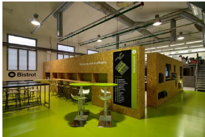
Fig. 4 – Login Milano. Il Bistrot