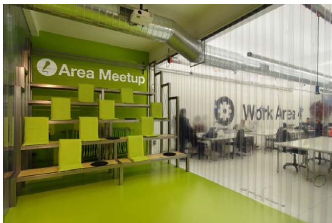
Fig. 6 – Login Milano. La gradonata per piccole conferenze nell'Area Meet Up