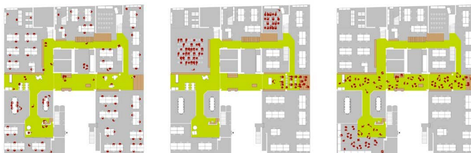
Fig. 7 – Login Milano. I tre scenari: cowork, learn, connect

Fonte: Riboldi e Torricelli, progetto per il Coworking Login a Milano (2011-14)