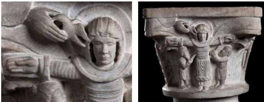
Figura 2. La crocifissione di santa Giulia e la mano di Dio (particolare). Brescia, Museo di Santa Giulia, < http://www.turismobrescia.it/it/punto-d-interesse/capitello-figurato-con-la-crocifissione-di-santa-giulia >.