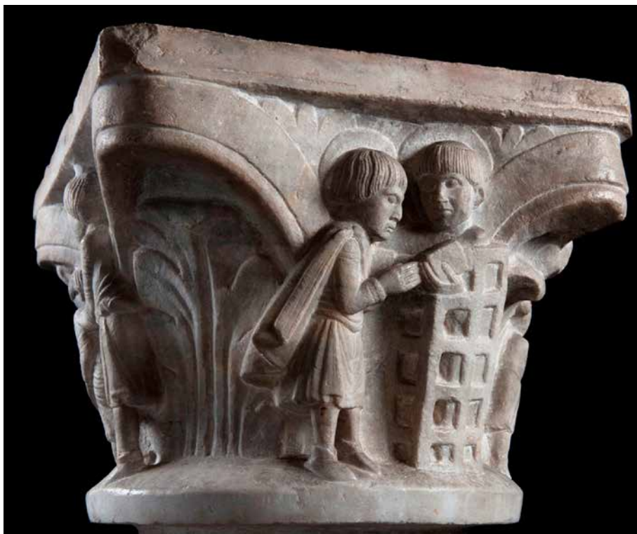
Figura 10. San Benedetto, san Martino e la regola benedettina. Brescia, Museo di Santa Giulia, < http://www.turismobrescia.it/it/punto-d-interesse/capitello-figurato-con-la-crocifissione-di-santa-giulia >.