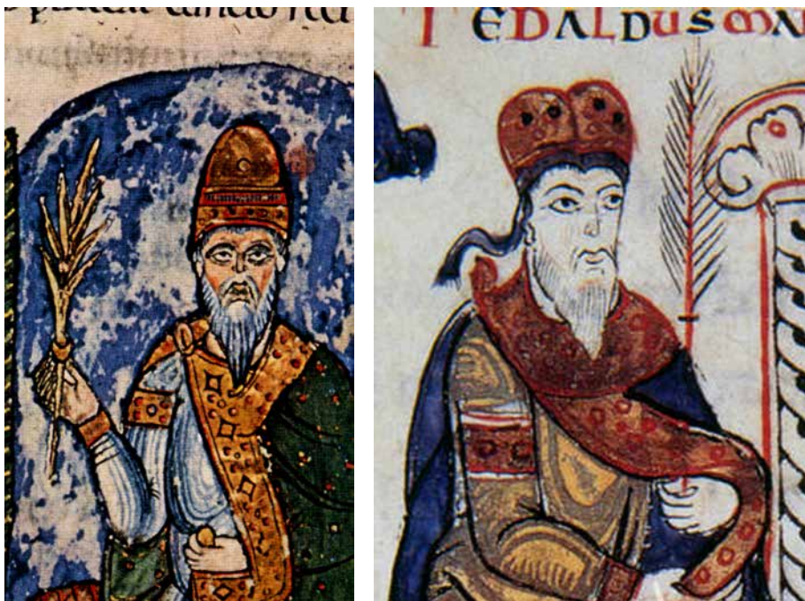
Figura 5. Bonifacio e Tedaldo di Canossa. Biblioteca Apostolica Vaticana, ms. Vaticano Latino 4922, ff. 28ve e 22r (T. Lazzari, Miniature e versi: mimesi della regalità in Donizone , in Forme di potere nel pieno Medioevo [secc. VIII-XII]. Dinamiche e rappresentazioni , a cura di G. Isabella, Bologna 2006 [dpm Quaderni - Dottorato 6], pp. 57-92).

gobardi, detto anche ramus arboris , un simbolo che richiama a un potere di ambito giuridico, effetto dell'originaria coscienza che lì dove governa un vero re mandato da Dio, germoglia una nuova vita dal duro legno 22 . Le verghe fiorite che Bonifacio e Tedaldo tengono in mano diventano allora, per Goetz come per Huth, simbolo del potere temporale della discendenza, un potere ottenuto però non attraverso una delega regia, ma per diretto riconoscimento divino.