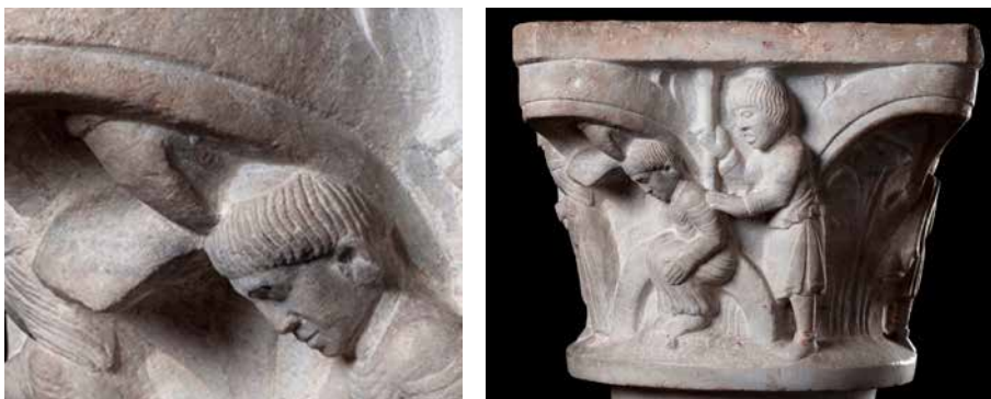
Figura 3. Il martirio di san Pimeneo e la mano di Dio (particolare). Brescia, Museo di Santa Giulia, < http://www.turismobrescia.it/it/punto-d-interesse/capitello-figurato-con-la-crocifissione-di-santa-giulia >.

bolo incongruente: può essere interpretato, infatti, come segno dell'esenzione dall'autorità vescovile di cui godeva il monastero. Letto in questo modo, è un segno che indica una realtà anteriore alla Riforma del secolo XI, certamente precedente alle fine del secolo XII - primi del XIII, che furono gli anni del papato di Innocenzo III e che coincidono con il periodo cui è attribuita la fattura