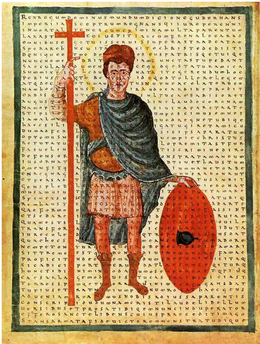
Figura 11. Ludovico il Pio, miles Christi . Biblioteca Apostolica Vaticana, Ms. Reg. lat. 124, f.4v, < https://it.wikipedia.org/wiki/Ludovico_il_Pio#/media/File:Ludwik_I_Pobo%C5%BCny.jpg >.