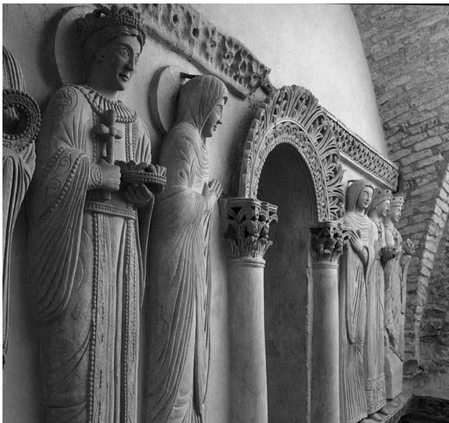
Figura 8. Tempietto di Cividale: la badessa accoglie principesse in monastero.

avanti, richiamano ossessivamente al rispetto della regola 30 , potrebbe riconoscere san Benedetto nella figura dietro l'ambone, Benedetto che consegna a san Martino, figura della chiesa transalpina, la regola, una regola che – come