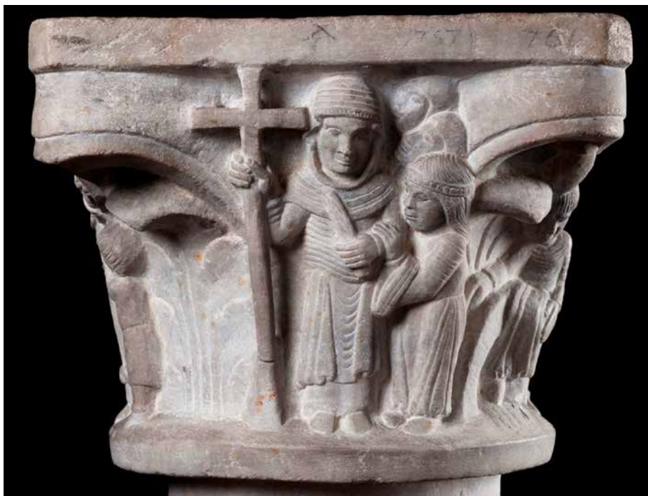
Figura 4. La badessa, Gisla e le monache. Brescia, Museo di Santa Giulia, < http://www.turismobrescia.it/it/punto-d-interesse/capitello-figurato-con-la-crocifissione-di-santa-giulia >.

del capitello 18 , anni in cui l'esenzione dall'ordinario diocesano di un cenobio femminile 19 era diventata difficile da sostenere.