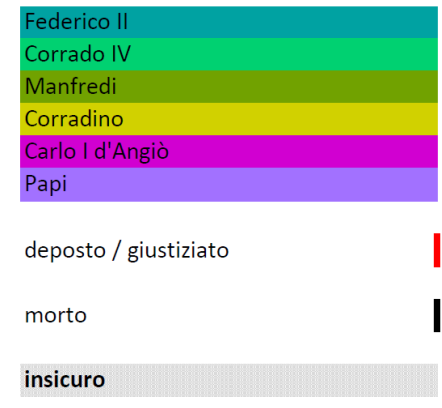
Fig. 1 - I conti e le contesse del Regno di Sicilia (1250-1273)

Osservando i dati, si nota che la gran parte dei periodi delle cariche non fu particolarmente lungo e che solo pochi conti riuscirono a trasmettere in eredità la propria contea; ancor meno furono quelli che lasciarono la carica dopo una morte pacifica. La maggioranza fu deposta con la violenza e sostituita da altri uomini vicini al vincitore. In alternativa, le contee furono lasciate vacanti oppure, al contrario, ristabilite quando ritenuto necessario.