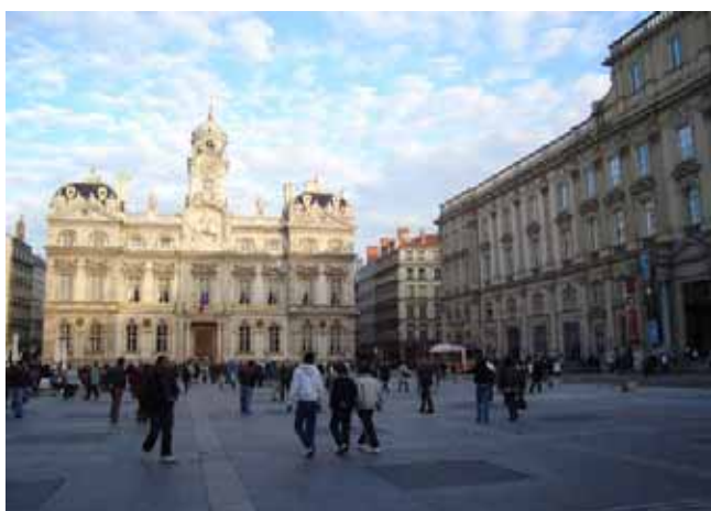
A Lione negli anni Novanta vengono realizzati parcheggi interrati sotto le piazze storiche della città, tra queste Place de la Republique (in alto) e Place des Terraux.

e riqualificato e rivitalizzato un centro in origine molto degradato e in fase di abbandono, inserendo inoltre una serie di opere di elevata qualità, sia in superficie che in sotterraneo (Bonomo 2003).