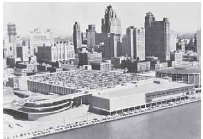
Alcune realizzazioni innovative di parcheggi negli anni Cinquanta e Sessanta negli USA: garage multipiano a Miami e autorimessa sull'Auditorium di Detroit.

limitate le strade da allargare e in modo tale da arrecare meno danni possibili e cercare di far passare i nuovi tracciati nei tessuti urbani malati o danneggiati (Humbert 1957).