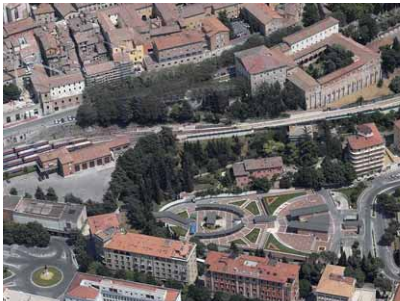
Il parcheggio di interscambio di piazzale Europa a Perugia realizzato alla fine degli anni Novanta.

coperto dalle auto in sosta ma le avvolge ordinandole in una rete di cornici di cemento».