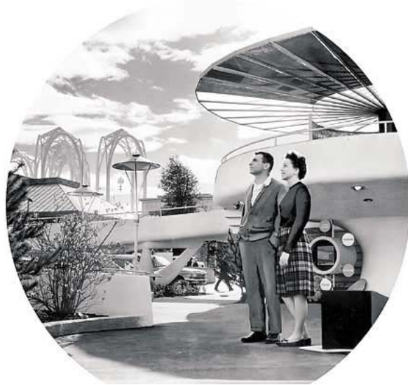
Le Expo costituiscono una vetrina della scienza e riflettono la fiducia verso il futuro

iinnovative ed eccezionali le opere fisiche e gli interventi immateriali connessi all'esposizione (Linden e Creighton 2008).