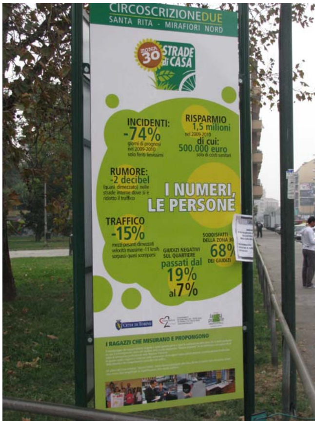
Un pannello illustra i risultati raggiunti nei primi due anni di vita della Zona 30 di Mirafiori Nord.

sicurezza nella zona, sulla percezione dei risultati ottenuti ecc.), di animazione (con eventi locali per favorire l'adesione al progetto), di empowerment (ad esempio con l'affidamento a soggetti locali della manutenzione dei nuovi elementi verdi o dei nuovi giochi inseriti).