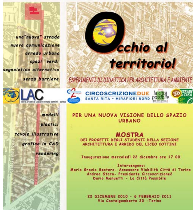
La locandina della mostra degli studenti del liceo artistico Cottini di Mirafiori Nord sulla Zona30.

monitoraggi dei comportamenti di guida, mentre gli allievi di un liceo artistico collaborano nella redazione dell'analisi della situazione urbanistica e dei progetti di riqualificazione dello spazio pubblico. In base ai risultati dell'ultimo monitoraggio, a due anni dal completamento dei lavori il 68% dei residenti esprime un parere favorevole rispetto alla Zona 30, il 7% un parere negativo. È migliorato anche il giudizio complessivo sull'area: il 31% degli intervistati ritiene che la sicurezza sia migliorata, e le valutazioni negative sulla qualità del quartiere sono passate dal 19% pre-intervento al 7%. Alla luce di tali esiti, diverse altre Circoscrizioni cittadine hanno richiesto al Comune la realizzazione di Zona 30 anche in porzioni del proprio territorio. Il mantenimento del numero complessivo dei parcheggi ha disinnescato uno dei timori più manifestati dai residenti all'avvio del progetto. Ha invece sollecitato proteste soprattutto l'introduzione dei sensi unici, al fine di ridurre la permeabilità dell'area rispetto ai flussi di attraversamento: le lamentele dei residenti hanno riguardato i percorsi maggiormente tortuosi da compiere per ritornare alle abitazioni, mentre i commercianti della zona hanno espresso il disappunto per una possibile perdita di potenziali clienti, a causa proprio del ridursi dei flussi di attraversamento.