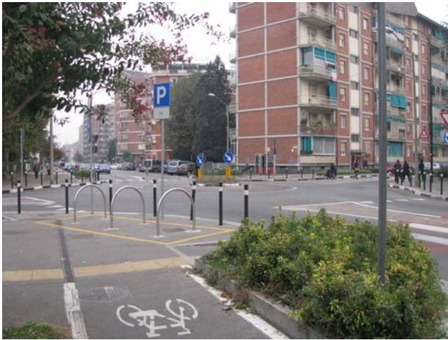
Una minirotonda nella Zona 30 di Mirafiori Nord.