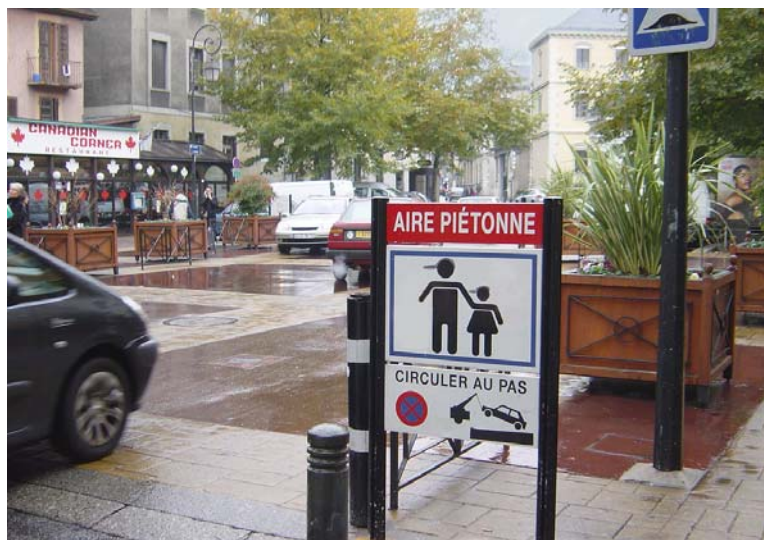
Un tratto di strada a precedenza pedonale a Chambéry in Francia.

Con ciò non si intende affermare che l'efficienza trasportistica delle strade sia un fattore negativo: una strada