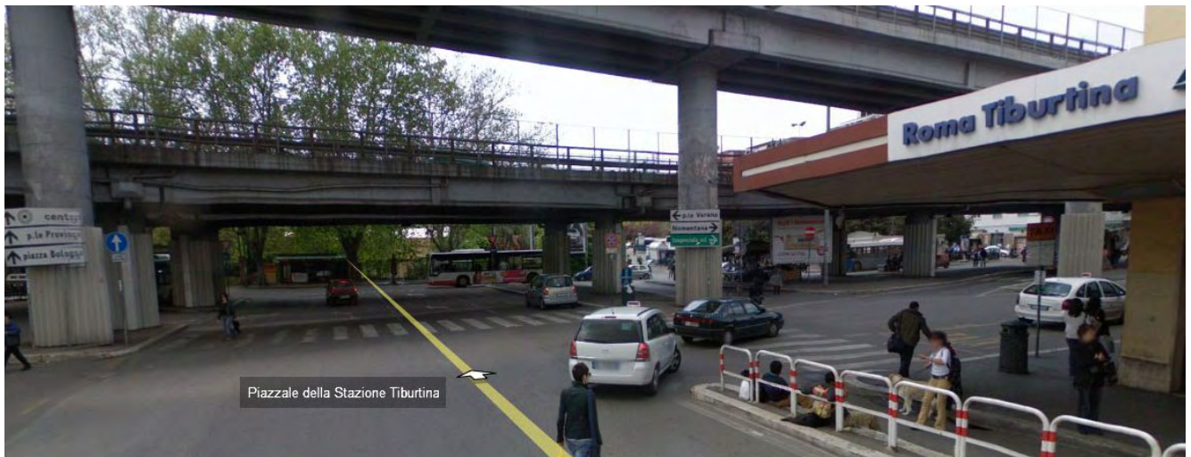
La stazione Roma Tiburtina oggi.