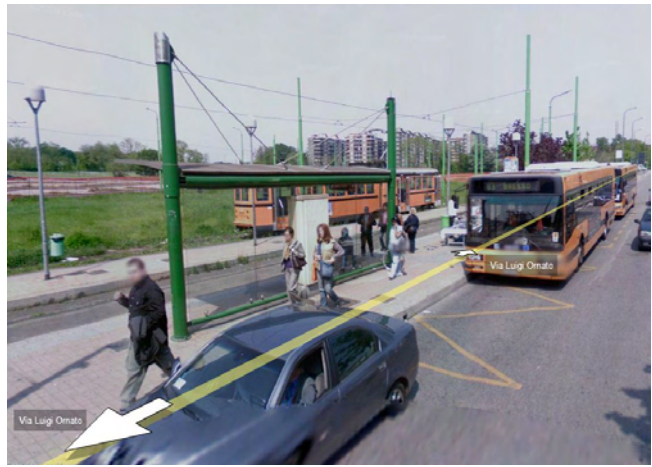
Parcheggio Ornato-Parco Nord a Milano.