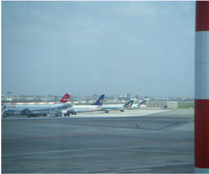
Aeroporto Capodichino di Napoli.