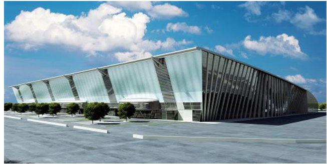
Oval Lingotto di Torino.