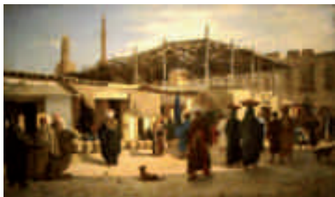
Marco De Gregorio, Mercato arabo , 1873

dell'Oriente. Nascono così vedute di paesaggi e ambienti dal tono intimista, rappresentazioni di scene di vita quotidiana popolate da personaggi ed animali esotici, immersi in un tempo sospeso e incantato, come quello che cattura il visitatore alla mostra Incanti e scoperte. L'Oriente nella pittura dell'Ottocento italiano al Palazzo della Marra di Barletta (5 marzo - 5 giugno 2011).