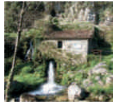
Foto 2 - Parco Nazionale del Cilento, Vallo di Diano e Alburni: Comune di Morigerati - Mulino idraulico Sicili