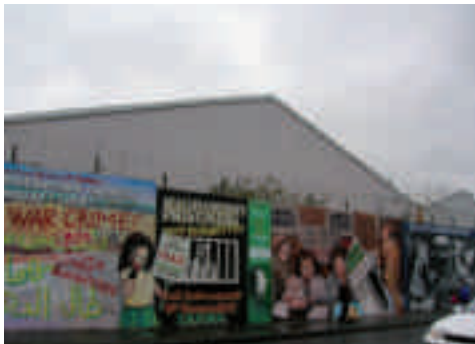
Falls Road (Republican/Nationalist area):

Remembrance Garden, recalling people died/imprisoned for political reasons: mural depicting the loyalist burning of Bombay Street in 1969 (top);