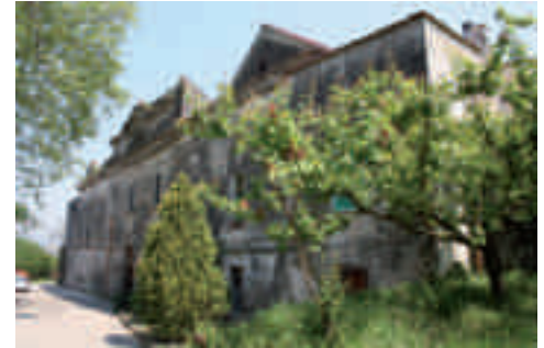
Foto 1 - Parco Nazionale del Vesuvio: Comune di Somma Vesuviana - Masseria Resina

abbeveratoi, mulini ad acqua o a vento, sistemi di contenimento dei terrazzamenti, sistemi di irrigazione e approvvigionamento idrico) - Foto 2;