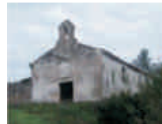
Foto 3 - Parco Nazionale del Cilento, Vallo di Diano e Alburni: Comune di Camerota, Cappella del cimitero vecchio

Il lavoro è consistito nel rilevamento, condotto utilizzando un modello di scheda di analisi