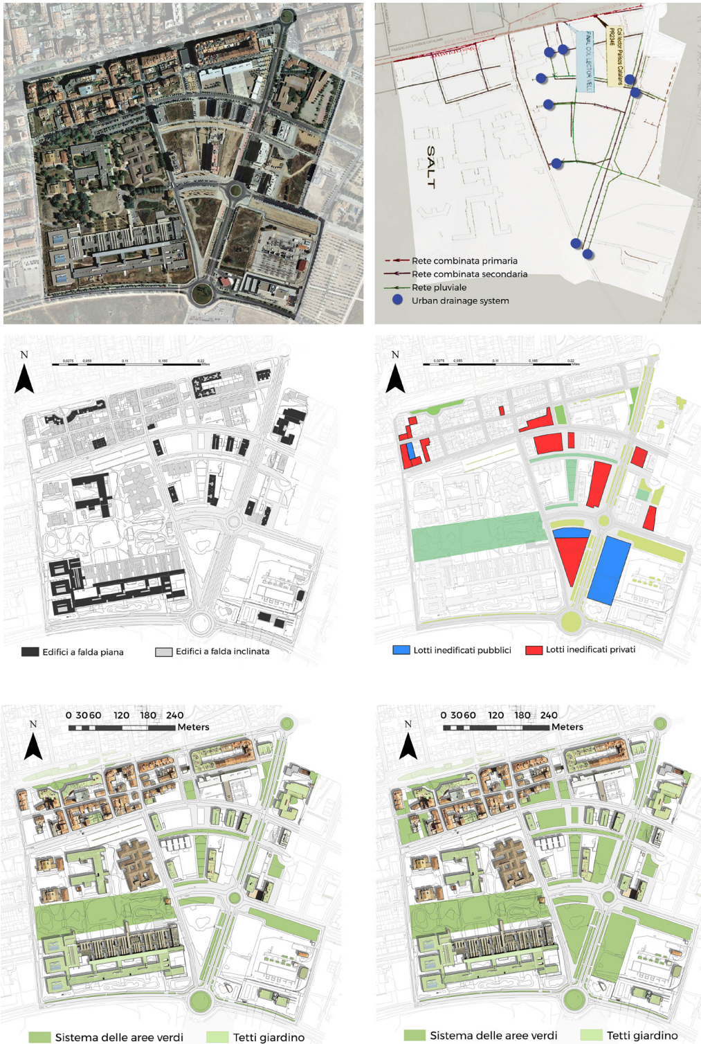
Fig. 2 - Schema del sistema del Barri del Mass Masò - Hospital

infiltration basins, in grado di alleviare la pressione sulla rete di raccolta in caso di precipitazioni intense, stoccando l'acqua in loco e nel resto del tempo essere fruibili come aree naturali ad uso ricreativo e sociale.