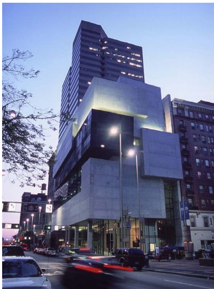
Fig. 5 Il "Centro di arte contemporanea" a Cincinnati di Zaha Hadid

Nei testi risalenti agli anni Settanta, l'approccio femminista mette in atto un più generale ripensamento dei concetti e dell'epistemologia di ogni singola disciplina, i cui contenuti vengono riletti e declinati con una certa enfasi sul ruolo marginale in cui sono state confinate le donne. In seguito le riflessioni metteranno in atto degli spostamenti sostanziali di tipo simbolico, determinando l'abbandono del terreno rivendicativo e mettendo in pratica direttamente la progettualità, con un riconoscimento, diretto ma anche implicito, della capacità di fare e quindi dell'autorevolezza che ne deriva (Bassanini 2008; Diotima 1996; Milanesi 1996; Marinelli 2002).