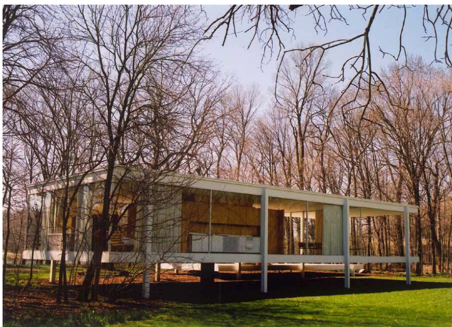
Fig. 4 La Farnsworth house di Mies Van der Rohe

siero della differenza. Per noi che siamo architetto e urbaniste la sua impostazione costituisce un punto di partenza fondamentale nella costruzione di una genealogia di madri, ancora troppo esigua, cui far riferimento per la costruzione di progetti dialoganti in grado di cambiare la città. E se ancora poco numerose sono le figure cui attingere, che siano architetto, ingegnere o urbaniste, numerosi e diversificati sono invece gli studi avviati per tracciare questa genealogia. Un ulteriore contributo per la conoscenza delle ricerche da più parti intraprese può essere avviato con un tentativo di sistematizzazione delle varie forme di narrazione attraverso cui mettere in ordine un panorama molto variegato composto da cataloghi e archivi, da antologie e monografie, da saggi critici e riviste dalle pagine patinate.