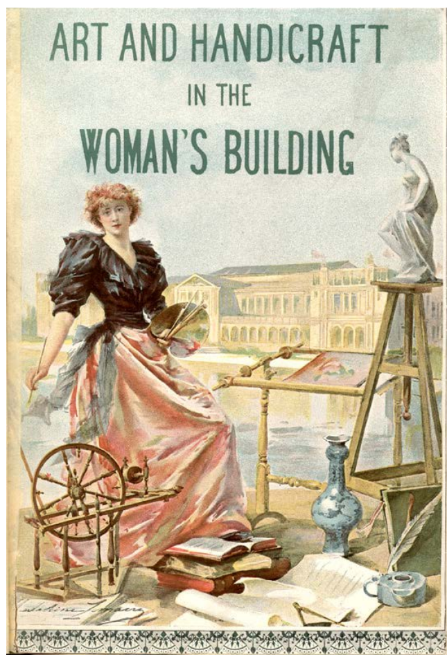
Fig. 2 Copertina del catalogo dell'Esposizione di Chicago del 1893 nel Woman's Building di Sophia Hayden

mette in atto pratiche di lavoro non gerarchiche e collaborative assieme a una riflessione critica sul vissuto delle donne, nello spazio domestico come in quello urbano, conducendo in parallelo anche indagini sul mondo professionale. Lavoro di progettazione e lavoro teorico procedono di pari passo in questo gruppo che si apre a esperienze partecipative tra amministrazioni, committenza e utenti, esplora il campo di applicazione del progetto sia nella dimensione transcalare sia in quella socioculturale, affronta la costruzione dello spazio in maniera inclusiva denunciando apertamente le forme di segregazione e di limitazione della mobilità delle donne (Matrix 1984). Il ricorso a forme di collaborazione partecipativa ha scardinato prassi consolidate e aperto il campo a nuovi orientamenti con visioni di progetto più “inclusive”. L’esplicito rifiuto verso le forme di competizione e di individualismo, presenti invece all’interno degli studi professionali tradizionali, ha privilegiato una condivisione di conoscenza e responsabilità che, nel valorizzare gli aspetti etici e il rispetto delle diversità, ha messo in discussione quelle dicotomie che avevano connotato buona parte della cultura femminista degli anni Settanta