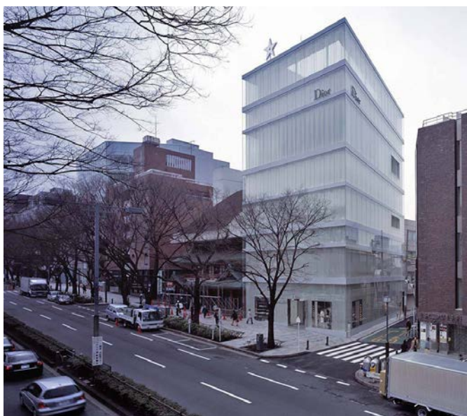
Fig. 6 Il Dior Building a Tokyo di Kazuyo Sejima